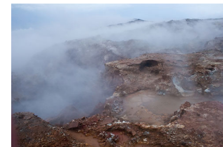
Горячий источник Ганнухвер