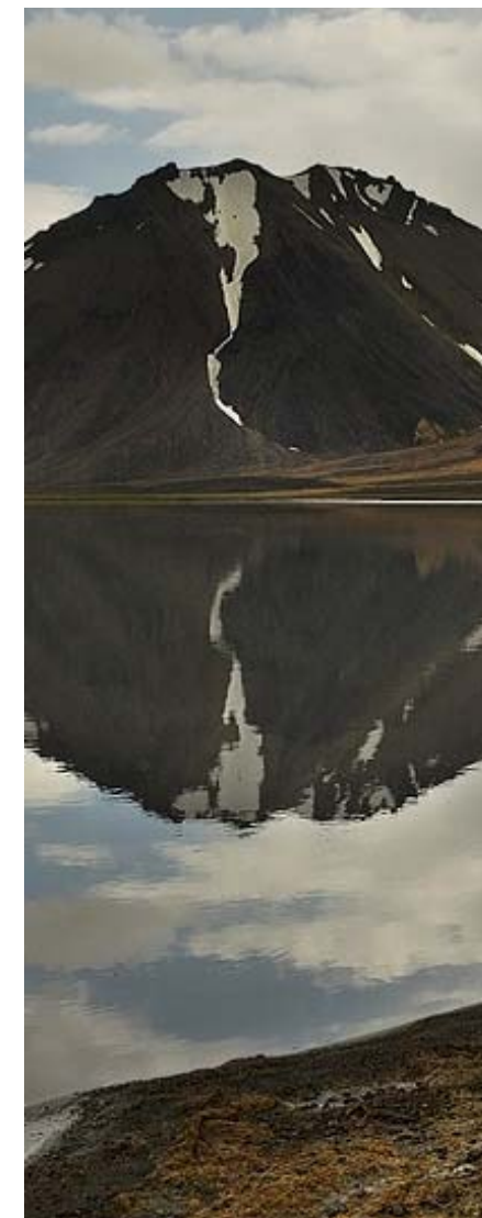
Исландский пейзаж.