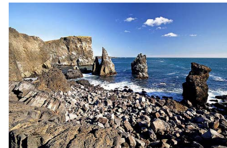
Вид с полуострова Рейкьянес