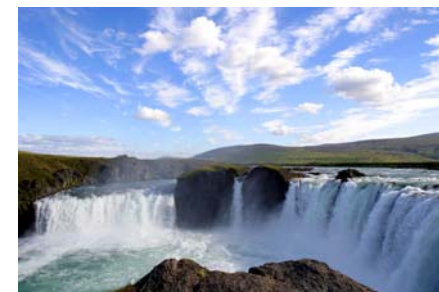
Водопад Годифосс.