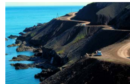
Дорога от п. Ньярвик