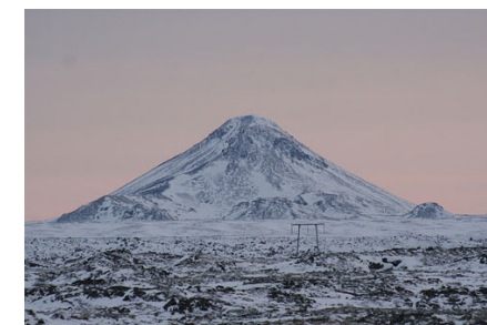
Вид на Кейлир