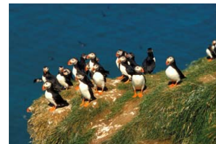
Паффины - символ Исландии