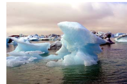
Лагуна Йокульсаарлон.