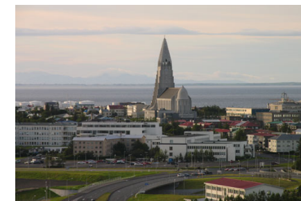
Вид на собор Хатльгримскиркья

Здание Жемчужина (Perlan) – несостарявшееся хранилище горячей воды – уникальный архитектурный комплекс, сооруженный в 1988 году, единственный в своем роде не только в Исландии, но и в мире. Сейчас в шести огромных цистернах расположены музей саг, повествующий об истории викингов, кафе, большой магазин сувениров, ресторан и смотровая площадка, откуда открывается потрясающий вид на город, поспорить с которым можно, может только вид с колокольни храма Хатльгримскиркья. На территории комплекса бьет из под земли рукотворный гейзер, «дыханием» которого управляет современная электронная система. А вокруг здания, по форме напоминающего жемчужину, исландцы заботливо высадили 180 тысяч деревьев.