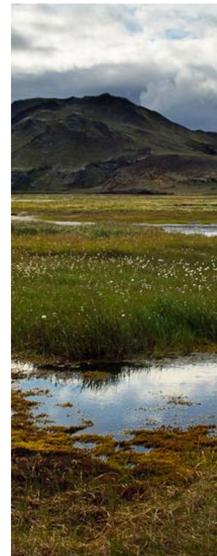
Исландский пейзаж II.